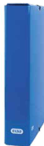
• Lomo 60 mm